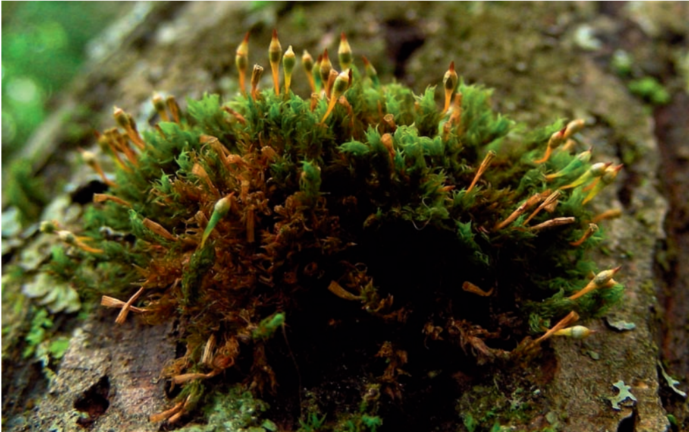
Abb. 1: Ulota rehmannii auf Salix caprea , Kappel, Freiburg, 30. Mai 2008.